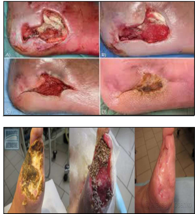
Şəkil 2. Sürfə terapiyası ilə müalicənin nəticələri.

Qonşu respublikalara gəldikdə isə, Ermənistanda 2004-cü ildə Mərkəzi Hərbi Hospitalda biocərrahiyyə laboratoriyası təşkil olunmuş, digər xəstəliklərlə yanaşı güllə yarası almış əsgərlərin müalicəsində də geniş istifadə olunur. 2005-ci ildən Ermənistan Cərrahlar Assosiyası tərəfindən, 2006-cı ildən Ermənistan Səhiyyə Nazirliyi tərəfindən sürfə terapiyası və bu metodun klinik istifadəsinə dair metodiki göstərişlər təsdiq olunmuşdur ( http://armlarvae.com ).