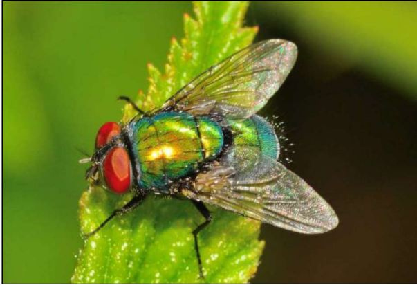
Şəkil 1. Lucilia sericata – yaşıl leş milçəyinin xarici görünüşü.

ekskrementləri üzərində gedir. Dışı fərdlər yumurtalarını hər birində 150-200 ədəd olmaqla topa şəklinə qoyurlar. Ümumiyyətlə, həyatı boyunca 2000-3000 yumurta qoyurlar.