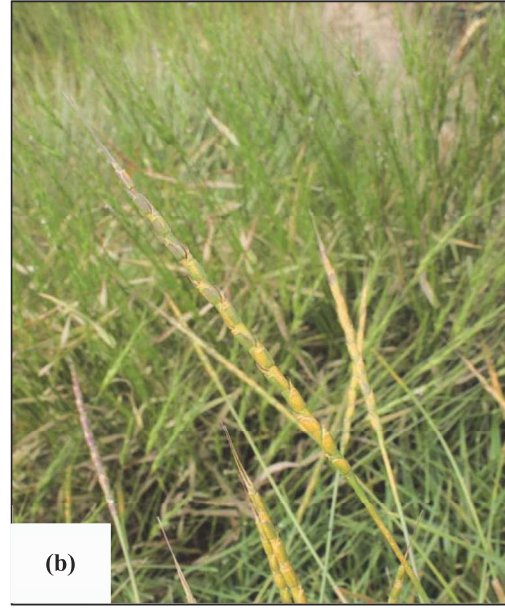
Şəkil 1. Ae. tauschii növünün ümumi görünüşü: (a) subsp. strangulata ; (b) subsp. tauschii

Növdaxili taksonların fərqləndirilməsi üçün bizim tərəfimizdən aşağıdakı əlamətlər istifadə edilmişdir: