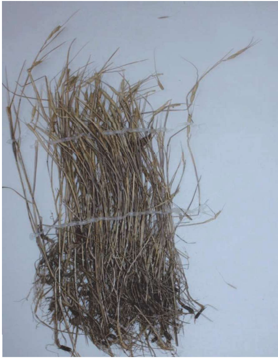
Şəkil 2. Ae. tauschii var. salinum Zhuk

Ae. tauschii buğdayıotu demək olar ki, Azərbaycanın bütün rayonlarında yayılmışdır, müxtəlif dövrlərdə ekspedisiyalar nəticəsində Azərbaycanın ayrı-ayrı bölgələrindən toplandığına dair məlumatlar mövcuddur. Dəniz səviyyəsindən aşağıda yerləşən yarımsəhradan (Abşeron) başlayaraq, Arandan tutmuş orta dağ qurşağına qədər demək olar ki, bütün